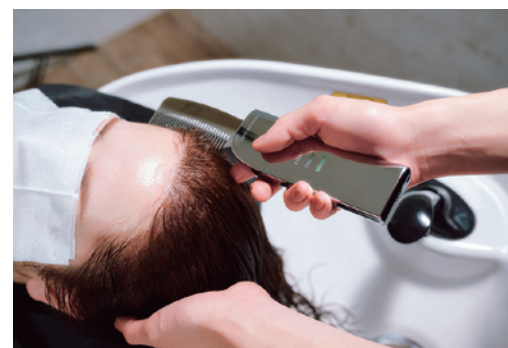
ヘアカラー施術後に「SCALPモード」を使用すると、頭皮にヘアカラー剤のアルカリ成分まで浸透してしまうためNG。同日に施術する際はヘアカラー前に行う。

「SCALPモード」は、超音波で微細化した美容成分を「エレクトロポレーション」で導入することで、地肌の環境を健やかに整えるモード。化粧水や美容液と併用して顔にも使用可能。通電のため、『パーミエイツコーム』を持つ手とは反対の手を必ず頭部に添えて使用する。