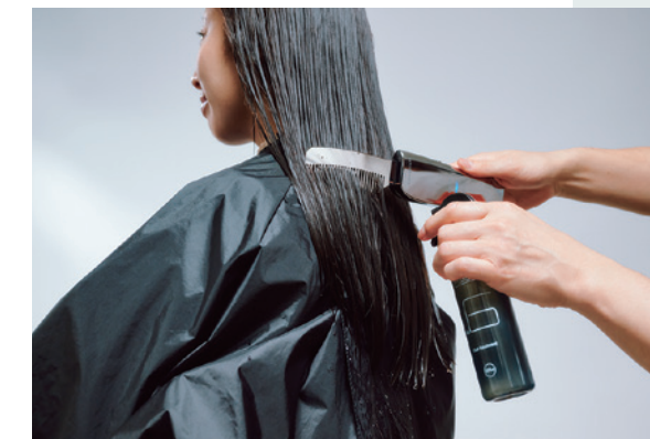
『ラトラクション システムトリートメント』との併用がおすすめ。補修成分を押し込み、まとまりの良いツヤ髪へ。

「TREATモード」では、超音波によって微細化されたトリートメント成分を、イオン導入の技術に応用した「イオンモイスター」によって毛髪内部に浸透させることができる。PATTERN2「ファッションカラー」で紹介した後処理や、インバス・アウトバストリートメントにも効果的。