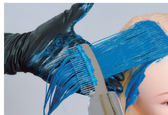
鮮やかな色みと色持ちを両立させて、提案の幅を広げることができる。

アルカリカラー剤だけでなく、酸性カラー剤・塩基性カラー剤にも使用可能。退色しやすい分子量の大きい染料を超音波で微細化し、「マイクロポレーション」で定着を促進する。