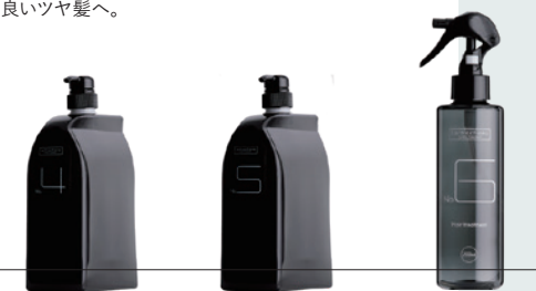
ラトラクション システム トリートメント4 ラトラクション システム トリートメント5 ラトラクション システム トリートメント6